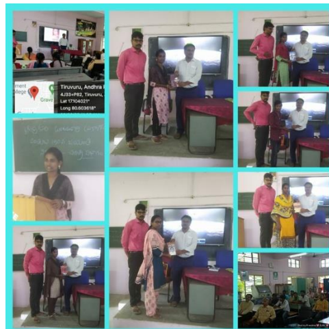
విద్యార్థులకు పుస్తక బహుకరణ 23.8.22